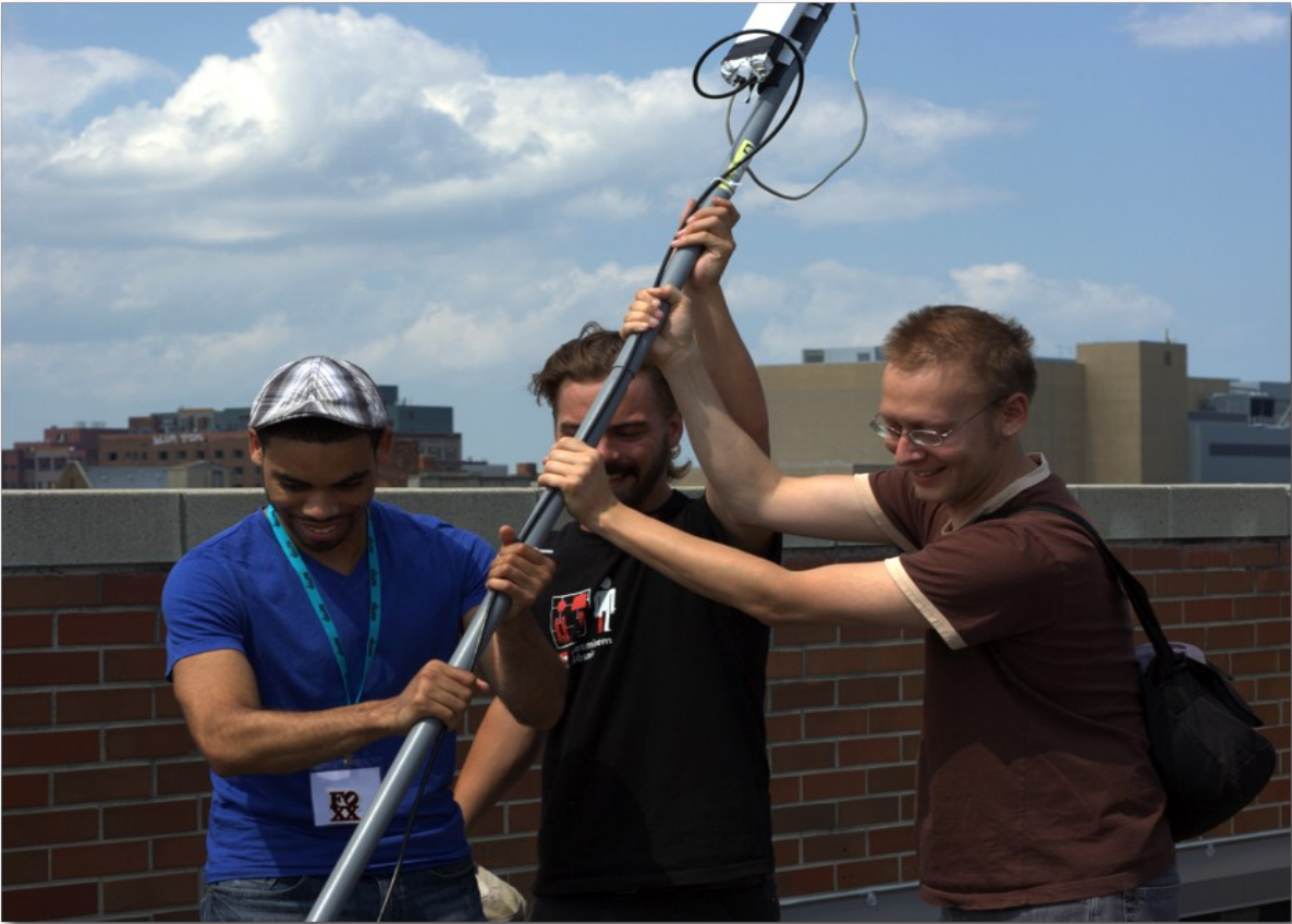
(3) : Preston Rhea – Licence CC BY-SA 2.0.

Montage d'un routeur (antenne) MESH-Wi-Fi installé sur un toit du quartier de MidTown à Détroit, juin 2011.