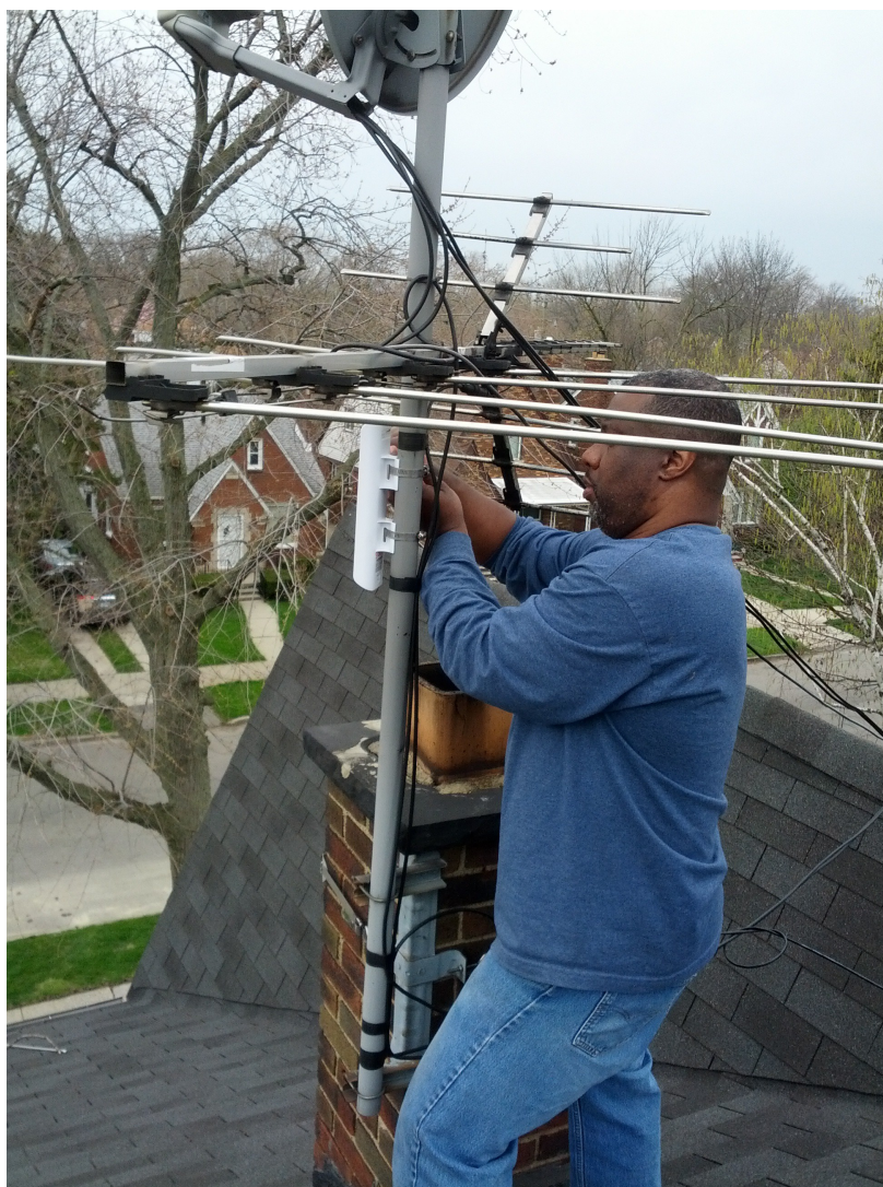
(5): Montage d'un routeur (antenne) MESH-Wi-Fi sur une antenne de télévision. Groupe Morning Sides MESH (juin 2011).

Maintenant, et si tu vas dans ces fermes urbaines, tu ne verras pas seulement une « race » ou un seul groupe d'âge. Il y a des jeunes, des noirs, des blancs, des asiatiques, tous travaillent ensemble dans cette logique de partenariat innovante, [...] c'est une chose d'aujourd'hui, pas du blabla, ce n'est pas un think tank, c'est un laboratoire à action ici.